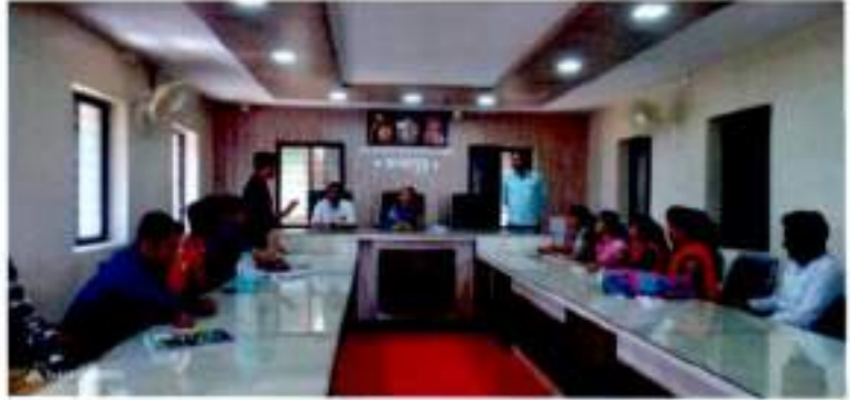
Visit of students to the Dr. Babasaheb Ambedkar historical statue of mangaon grampanchyat and also visiting different development sites of the mangaon.

माणगांव ग्रामपंचायत भेटप्रसंगी डॉ.बाबासाहेब आंबेडकर यांच्या ऐतिहासिक स्मारकास भेट तथा ग्रामपंचायतीने केलेल्या अन्य विकास कामांची पाहणी करताना राज्यशास्त्र विभागाचे विद्यार्थी.