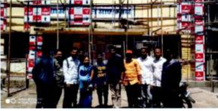
Visit of students from political Science department to the Mangaon Grampanchyat

माणगांव ग्रामपंचायत भेटप्रसंगी राज्यशास्त्र विभागाचे विद्यार्थी.