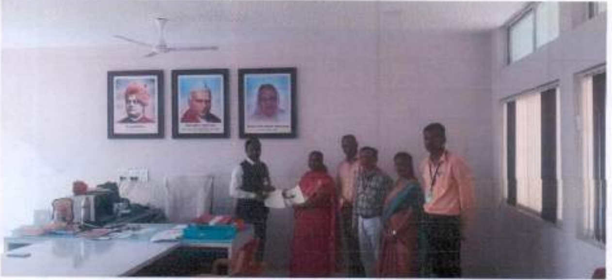
Linkages Smt. Akkatai Ramgonda Patil Kanya Mahavidyalaya, Ichalkaranji

अक्काताई रामगोंडा पाटील कन्या महाविद्यालय इचलकरंजी