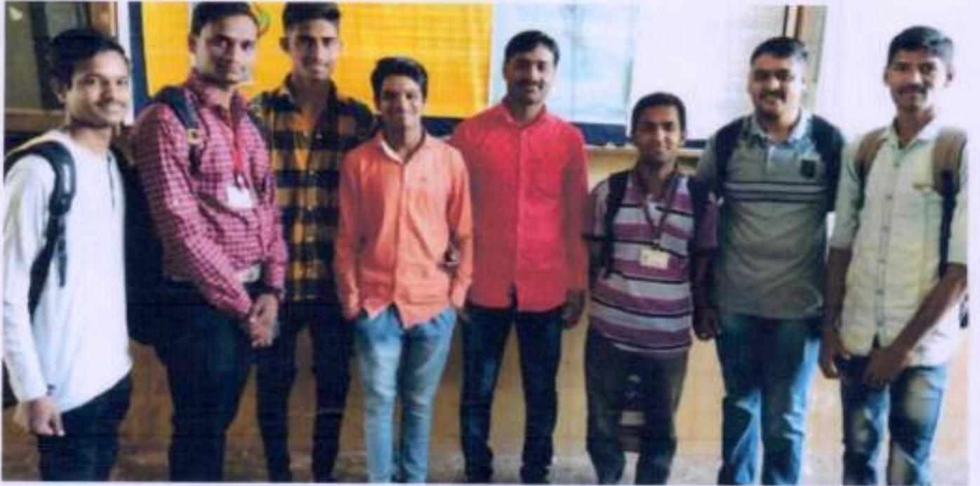
भित्तीपत्रिका सादरीकरण प्रसंगी राज्यशास्त्र विभागातील S.Y B.A चे विद्यार्थी.