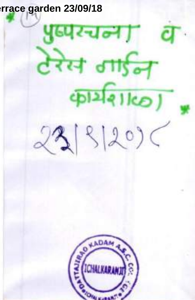
Student of B.A. III participated in one day floral composition and terrace garden training at Sangli 23/09/2018