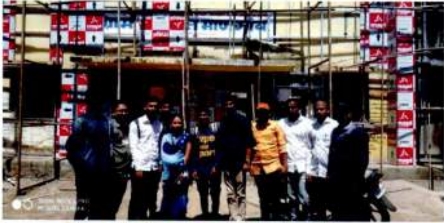
(Date -04/03/2020 ,Time - 11:00 AM )

( अस्पृश्यता परिषद शताब्दी वर्षानिमित्त - 1920-2020 )