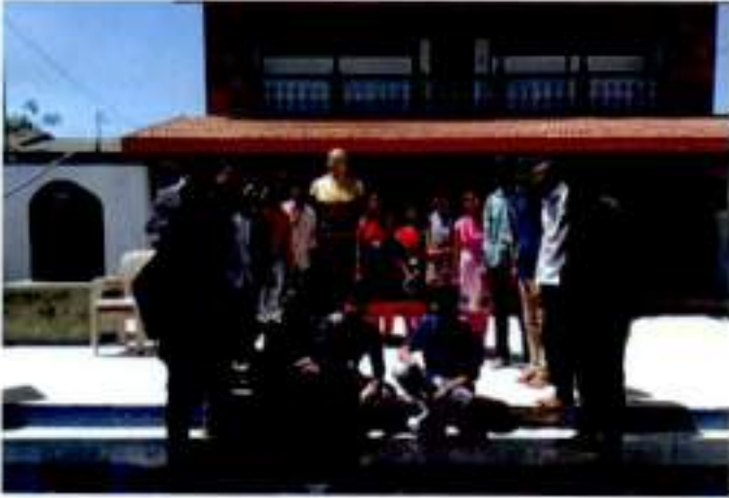
माणगांव ग्रामपंचायत भेटप्रसंगी डॉ.बाबासाहेब आंबेडकर यांच्या ऐतिहासिक स्मारकास भेट तथा ग्रामपंचायतीने केलेल्या अन्य विकास कामांची पाहणी करताना राज्यशास्त्र विभागाचे विद्यार्थी.