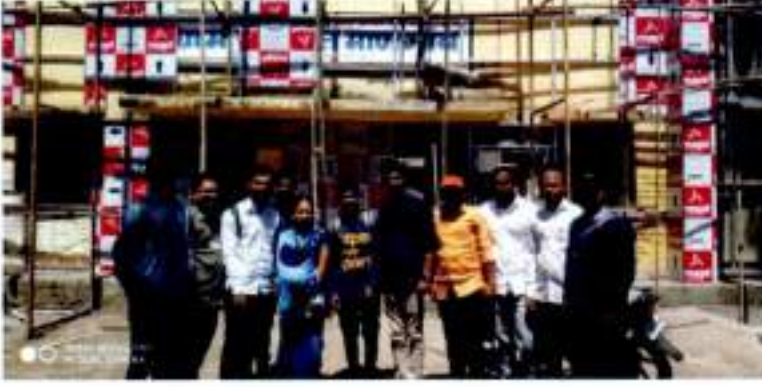
माणगांव ग्रामपंचायत भेटप्रसंगी राज्यशास्त्र विभागाचे विद्यार्थी.