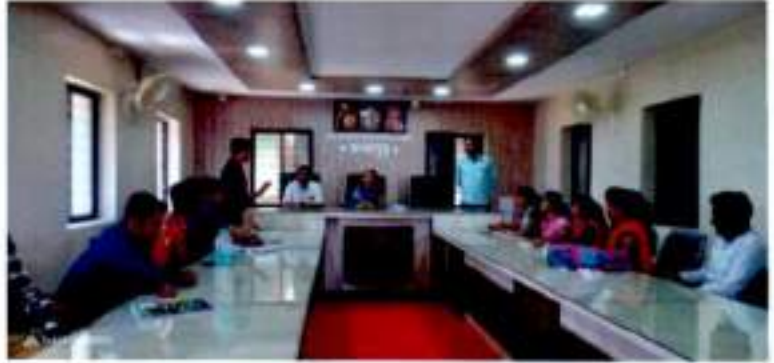
माणगांव ग्रामपंचायत भेटप्रसंगी सरपंच व ग्रामसेवक प्रशासनाकडून माहिती घेताना राज्यशास्त्र विभागाचे विद्यार्थी.