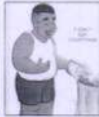
Do not waste Food