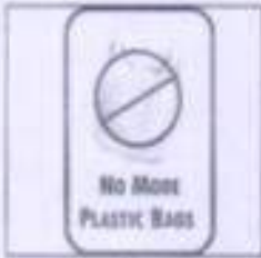
No to Single use