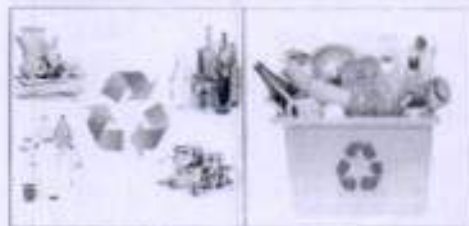
Make new Product