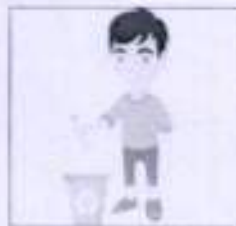
Use Again - Bottle