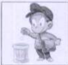
Use Again - Paper