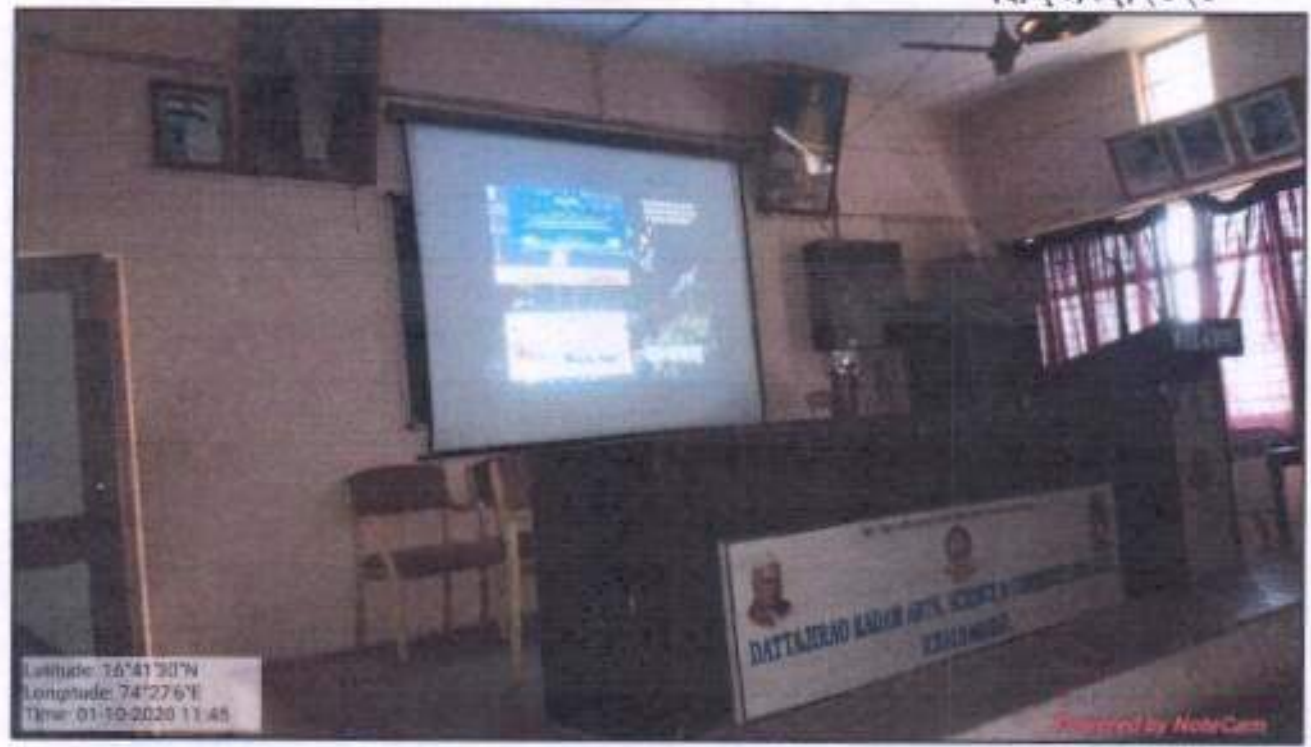
महाविद्यालयात "अवकाश आणि भूस्वानिक तंत्र; एक परिचय" या विषयावर 'इस्रो' च्या वतीने आयोजित एकदिवशीय ऑनलाईन कार्यशाळा प्रक्षेपण