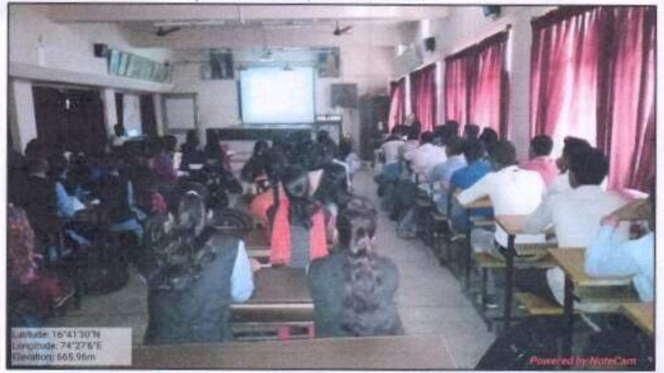
महाविद्यालयात "अवकाश आणि भूस्थानिक तंत्र: एक परिचय" या विषयावर 'इस्रो' च्या वतीने आयोजित एकदिवशीय ऑनलाईन कार्यशाळेत सहभागी विद्यार्थी-विद्यार्थीनी