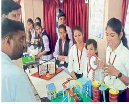
इचलकरंजी : डीकेएससी महाविद्यालयात व्हिजन स्पार्क संशोधन स्पर्धेत विद्यार्थ्यांनी अनेक ज्वलंत विषयांवर पोस्टरसह मॉडेलची मांडणी केली.

अभियांत्रिकी आणि तंत्रज्ञान, मानवशास्त्र भाषा, वाणिज्य व्यवस्थापन, शुद्ध विज्ञान, शेती आणि पशुधन, वाणिज्य आणि व्यवस्थापन कायदा याप्रमाणे प्रमुख विषयांसह प्रकार स्पर्धेसाठी होते. यामध्ये संशोधन वृत्तीचा विस्तार करत विद्यार्थ्यांनी पोस्टर्ससह मॉडेलची मांडणी केली. मानवशास्त्र भाषा प्रकारात पट्टणकडोलीच्या विरदेव यात्रेतील फरांडे बावांचा भाकगूक ते तृतीयपंथी समूहाच्या समस्या आणि उपायोजना, वाणिज्य व व्यवस्थापनमध्ये पैशाचा प्रवास, गूळ उत्पादनातील भेसळ, भरडधान्य चळवळ, वाणिज्य शहर आदी विषय विस्तारतेने मांडले. अभियांत्रिकी आणि तंत्रज्ञानात स्मार्ट हेल्मेट असे विषय