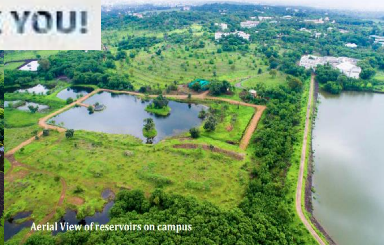
Aerial View of reservoirs on campus